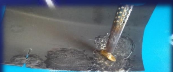
クリップ 金属メッシュ ファイバー